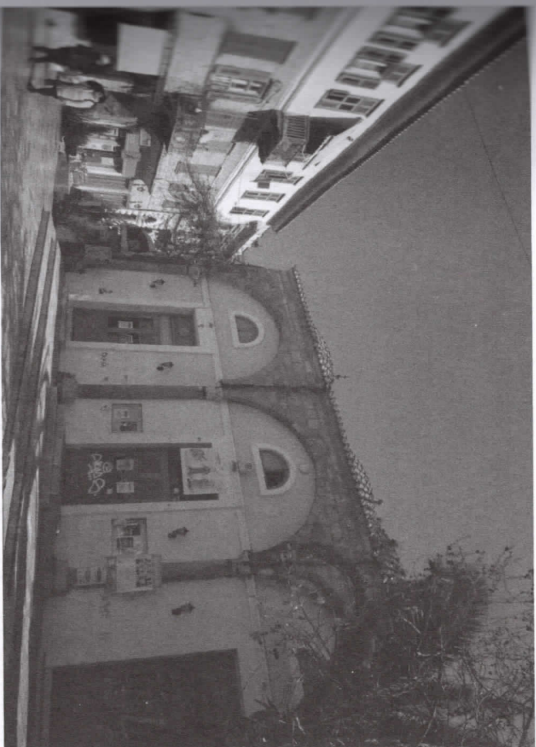
Εικόνα 3. Το οθωμανικό Μεγάλο Τζαμί στην πλατεία Συντάγματος του Ναυπλίου ως χώρος πολιτιστικών εκδηλώσεων.

• Το Μεγάλο Τζαμί αποκαθάρθηκε εν μέρει από την όντως βάνωση παλαιά επανάχρησή του (εικόνα 3). Είναι πλέον πολιτιστικό κέντρο, συντηρημένο και προστατευμένο μνημείο, και