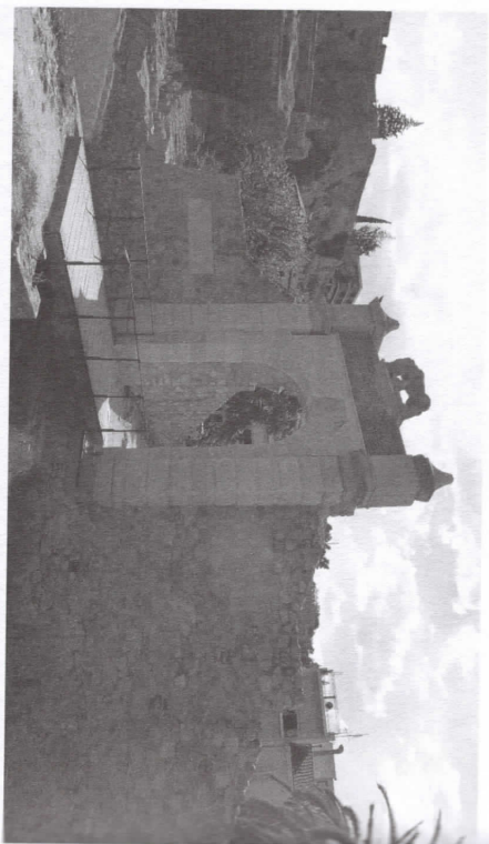
Εικόνα 4. Η Πύργια της Θάλασσας στο Ναύπλιο μετά την ανακατασκευή της.

κής ιστορικής κάθαρσης του Ναυπλίου, ζούμε την επαναμνημοποίηση τεκμηρίων του ενετικού και οθωμανικού παρελθόντος. Σύμφωνα με τις τρέχουσες αντιλήψεις, αυτά τα τεκμήρια είναι άξια προς διάσωση και έχουν θέση δίπλα στο ελληνοκλασικό και την κύρια αφήγηση που εκπέμπει το περιβάλλον της πόλης ως πρωτεύουσας της Επανάστασης και πρώτης πρωτεύουσας της χώρας.