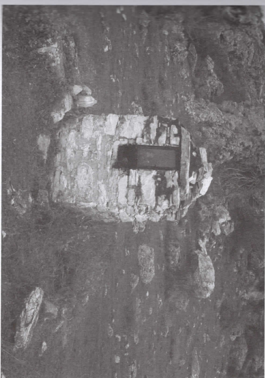
Εικόνα 1. Προοικοννητάρι δίπλα στον δρόμο κοντά στη λίμνη Κάδλια της Θεσοαίας.

Όμως, παρό τον θεσμικό και επιστημονικό προοδολογισμό και τη συνακόλουθη προσοαία της υλικότητας των μνημείων, συνεχίζει και στους πιο σύγχρονους πολιτισμούς να επιβιώνει η πλάνη αρχαϊκή διάστασή τους. Ένα προοικοννητάρι-αφιέωμα στην άκρη ενός επαγγελματικού δρόμου (εικόνα 1) δεν έχει ουδέμια θεσμική κατοχύρωση ή προσοαία, ουδέμια επιστημονική επένδυση. Όμως παραμένει και θα μείνει ανέγγιχτο λόγω του συλλογικού σεβασμού που συγκεντρώνει. Είναι ένα μνημείο in context (δηλαδή ενσωματωμένο στο πολιτιστικό περιβάλλον του), στο οποίο παρέχεται μια άτυπη «εθμική» προσοαία. Μνημείο είναι επίσης το θεσμικά προσοατευμένο (με βάση εξαιρετικά αυστηρούς νόμους) και επιστημονικά τεκμηριωμένο (με βάση επίσης αυστηρά μεθοδολογικά κριτήρια) κτίριο ή έργο τέχνης. Όταν συνταιριάζουν αυτά τα δύο, δηλαδή